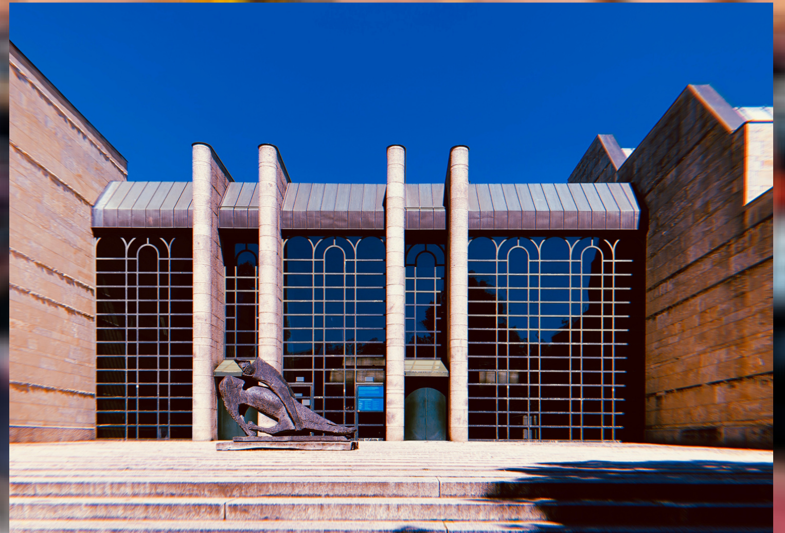
la Neue Pinakothek