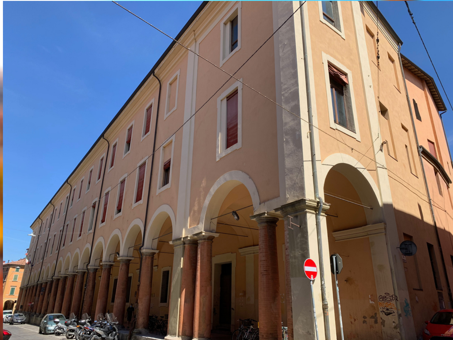
il Liceo Ginnasio Luigi Galvani